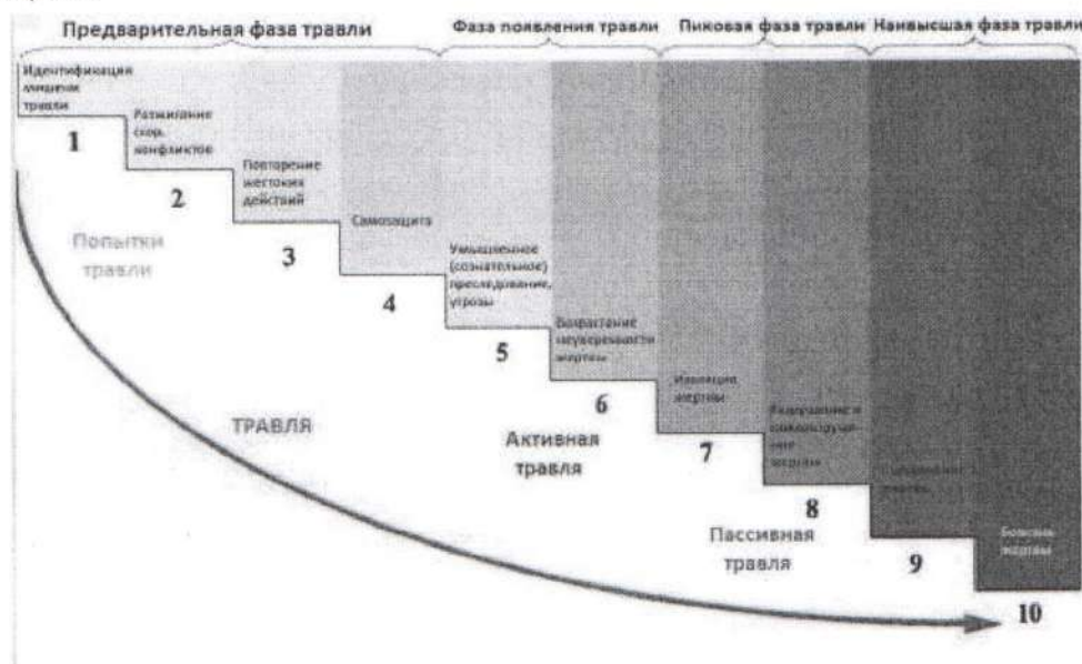
Рис. 3 Фазы буллинга

Буллинг как правило развивается по определенной схеме и имеет несколько фаз развития, которые можно изобразить как «лестницу» (рисунок 3). От момента зарождения до наивысшей фазы. Каждая ступень – это определенный этап развития, он соответствует определенному эмоциональному состоянию пострадавшего и определенным действиям обидчика. Вмешательство и прерывание процесса возможно на любой ступени, поэтому так важно распознать этот процесс.