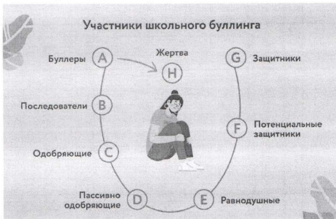
рис. 2. «Схема» буллинга

Итак, какой бы ни была причина данной ситуации, в ней всегда есть несколько «ролей» - рис. 2.